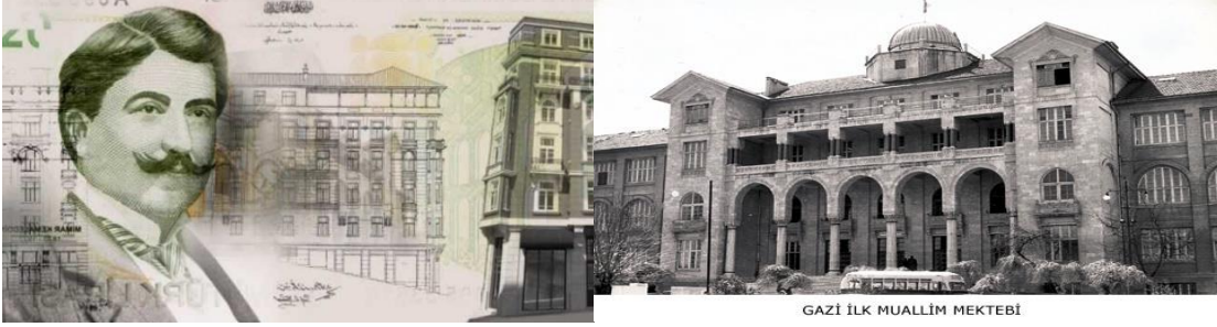
GAZİ İLK MUALLİM MEKTEBİ

20 TL'nin üzerinde resmi olan Kemalettin Bey ,Türk kültürüne ait özelliklerle birlikte Dünya'daki başka kültürlerle ait özellikleri birleştirerek yeni binalar, köprüler, saraylar vb inşa etmiştir. Osmanlı'nın son dönemlerinde verdiği eserler ile adını Dünya'ya duyuran Kemalettin Bey kendi alanın gelmiş geçmiş en büyük kişilerinden kabul edilmektedir.