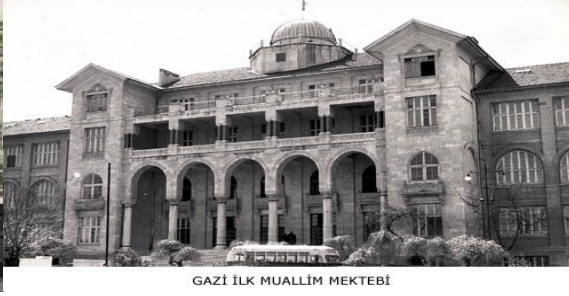
GAZİ İLK MUALLİM MEKTEBİ